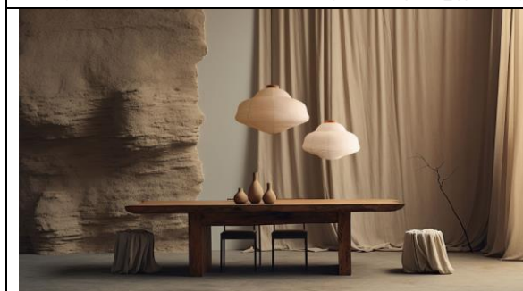
KIMU DESIGN CO., LTD/Paper Milk Light Collection

新シリーズ Torg(トリエ)。磁器、白土、黒土、赤土の4種類の素材を活かし釉薬や焼き方にも工夫を凝らしました。