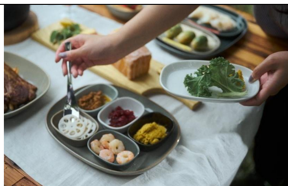
(株)ポトペリー/トリエ

手のひらに乗せても分かる小さなサイズ感がこの花器の魅力。いつものデスクにキッチンに、小さな彩りを添えて。