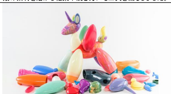
(株)ケンエレファント/UNISUS PPF

東洋的感性と自然素材を融合した台湾の照明デザイン。空間に静かな光と心地よい雰囲気をもたらします。