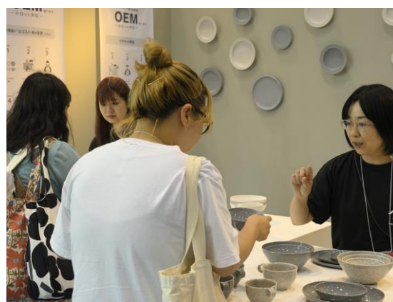
2025年の「インテリア ライフスタイル」会場の様子(左)と、商談の様子(右)