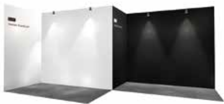
※隣接小間イメージ(袖壁が左側の場合)